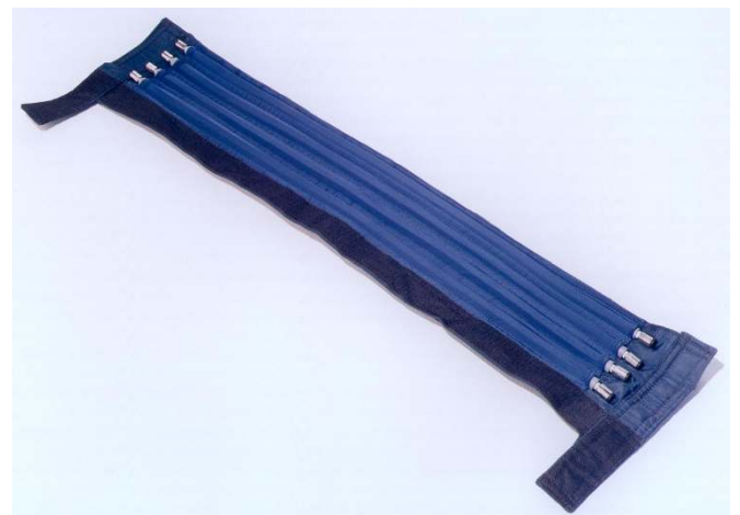
(ホース保温カバー)

カバーは、耐久性の有るウレタン繊維で断熱材を挟んだ三層になっており、マジックテープにより材料ホースとの着脱が容易に出来ます。使用条件により、弊社の「高圧用熱交換器」・「高圧二重ホース」との併用をお勧めいたします。 使用条件により、温調水ホースの数、カバーの長さを選定致しますので、弊社までお問い合わせ下さい。